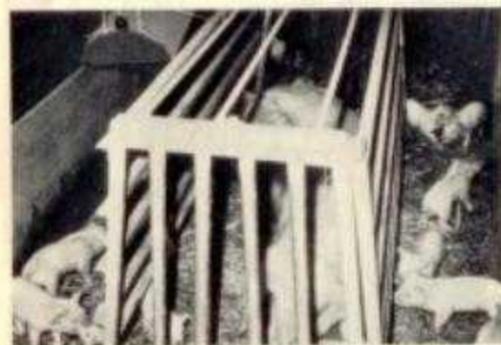
Een goede toom

De toename van de suikerbietenteelt ging grotendeels ten koste van de voederbieten. De voederbietenteelt is van weinig betekenis meer. Dit blijkt ook wel uit het feit dat in 1963 nog op 112 bedrijven gemiddeld 41 are voederbieten werden verbouwd. In 1968 is dit 37 bedrijven met gemiddeld 31 are. Het aantal suikerbietentelers bedroeg in 1968 50 met een gemiddelde oppervlakte van 128 are.