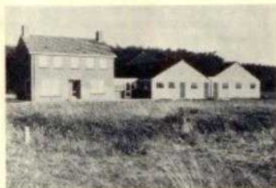
Eén van de nieuwe boerderijen