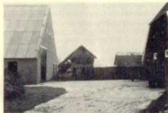
Een goede erfverharding

De knollenplukmachines zijn bij twee combinaties van elk drie boeren geplaatst.