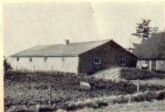
Een voorbeeld varkerstal

De belangstelling voor deze excursies was er steeds in ruime mate.