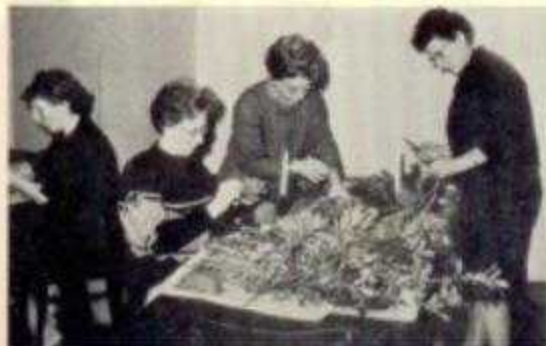
Het maken van bloematukjes

De warmwatervoorziening is in de laatste jaren sterk verbeterd. Wanneer er een douche komt moet men hieraan ook aandacht besteden.