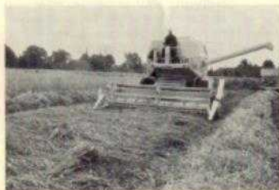
De maaisorser in actie

De bovengenoemde cijfers spreken voor zichzelf. Op alle onderdelen een sterke uitbreiding in de mechanisatie en de arbeidsbesparende methoden. Wat de sorteermachines + leesband betreft, deze zijn vrijwel steeds voor gezamenlijk gebruik aangeschaft. Met de 12 machines in 1968 maken 21 landbouwers hun aardappelen klaar.